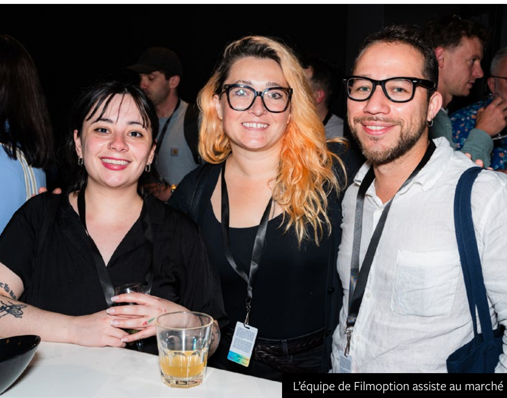
L'équipe de Filmoption assiste au marché