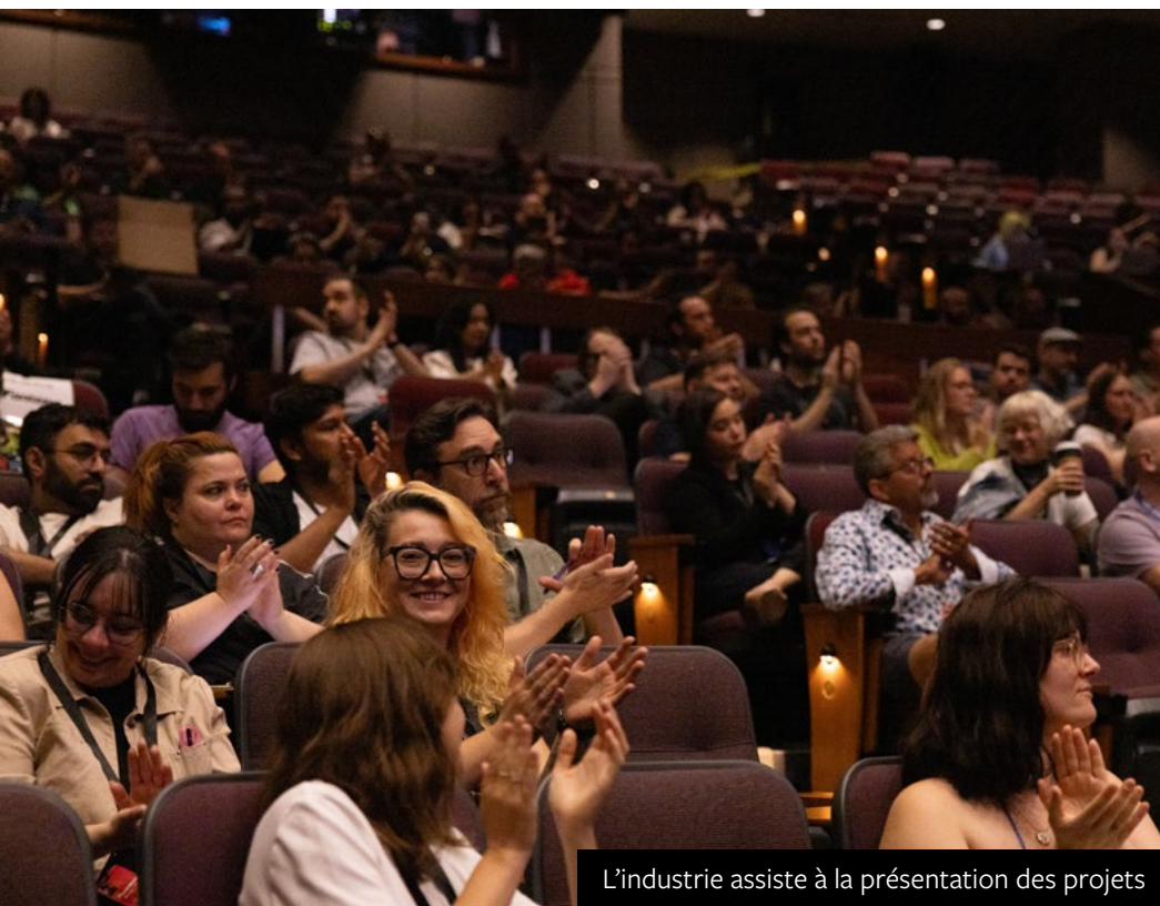
L'industrie assiste à la présentation des projets