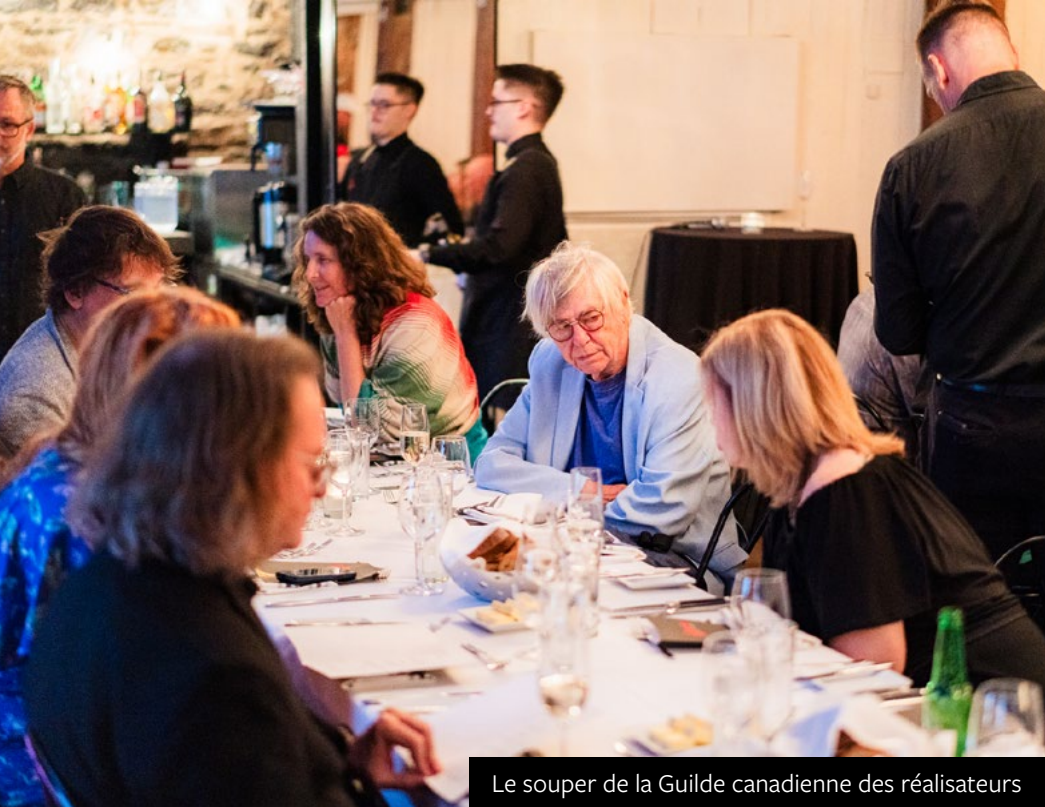
Le souper de la Guilde canadienne des réalisateurs