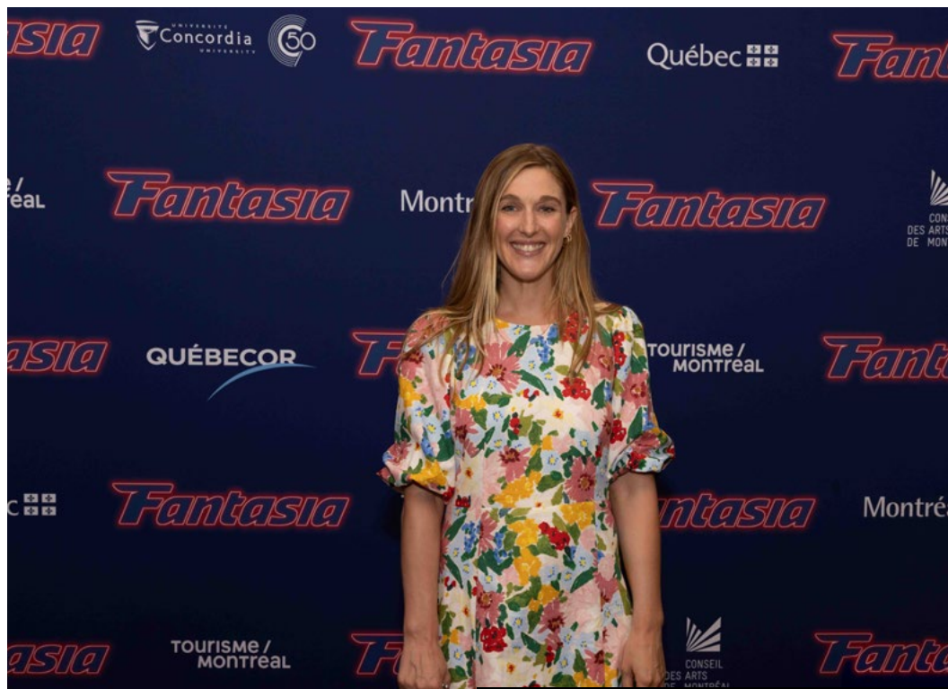
Mylène Mackay sur le tapis rouge d'Ababouiné