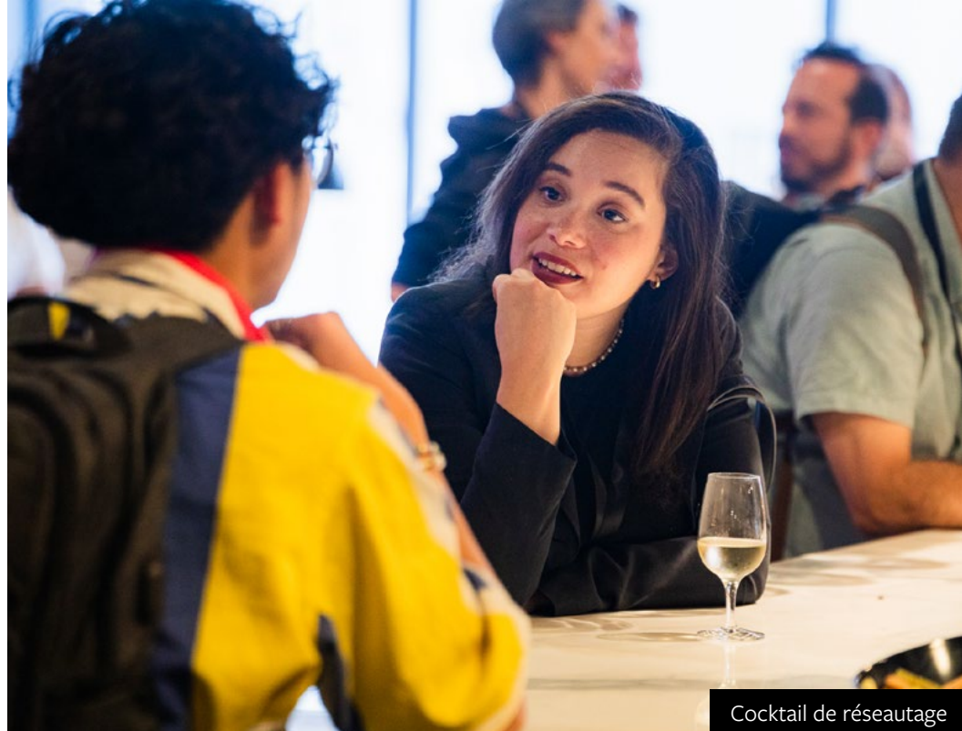
Cocktail de réseautage