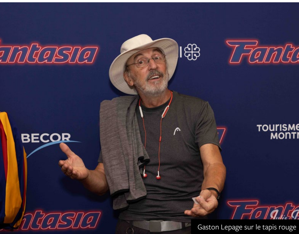
Gaston Lepage sur le tapis rouge