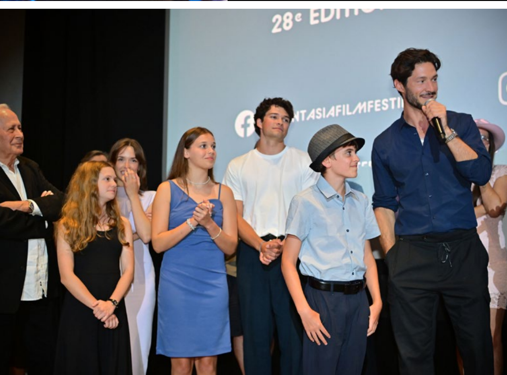
Les acteurs du film Ababouiné lors de la séance de question suite au film